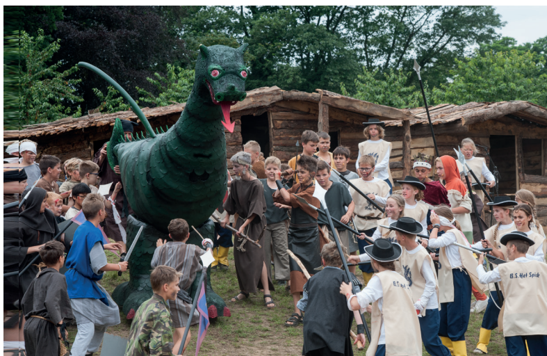
Kinderdraaksteken 2016.

de jaarrekening van de stichting en brengt zij daarmee aan de schutterij algemeen verslag uit over het gevoerde beleid.