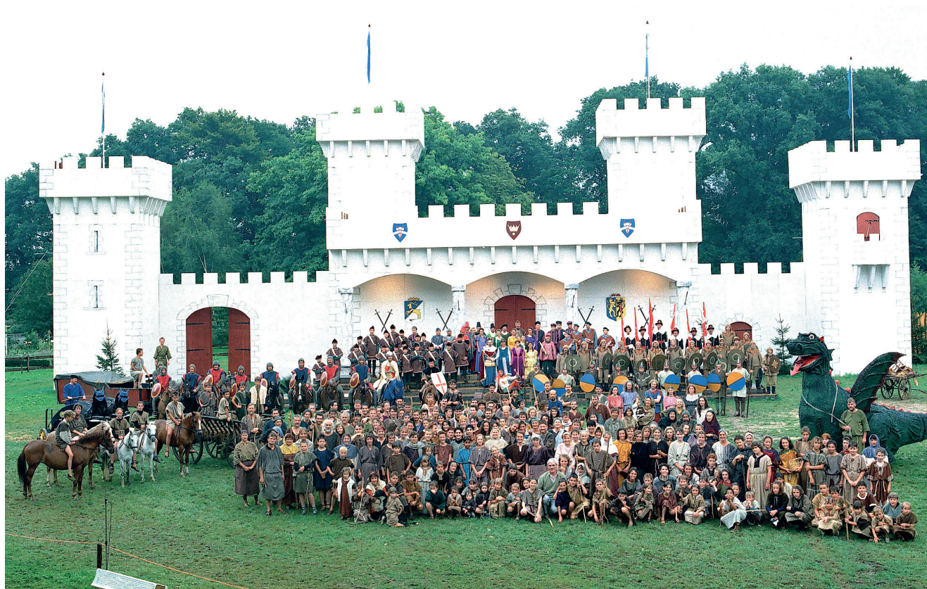
Groepsfoto 1988.

Tevens is erin opgenomen dat de oorsprong en de bijzondere rol van de schutterij in de historie