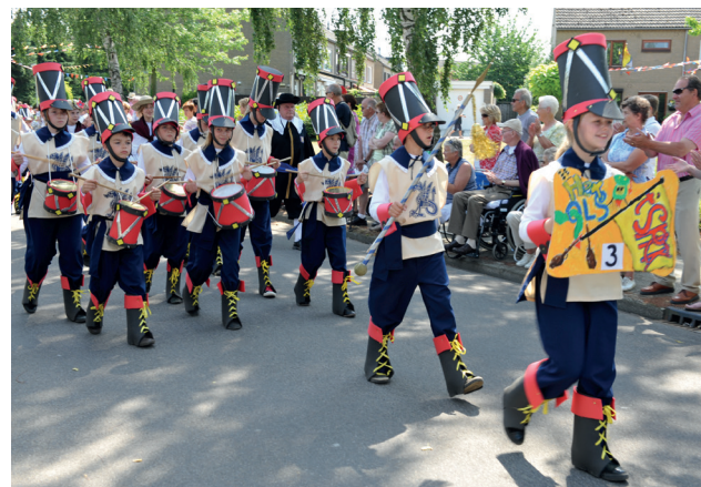
Kinjer-OLS-2010 in Grubbenvorst.

Het Kinderdraaksteken, voor het eerst in 2009 georganiseerd, was een initiatief van de stichting. De jaarlijkse deelname, vanaf 2009, aan het Kinjer-OLS in samenwerking met basisschool 't Spick en