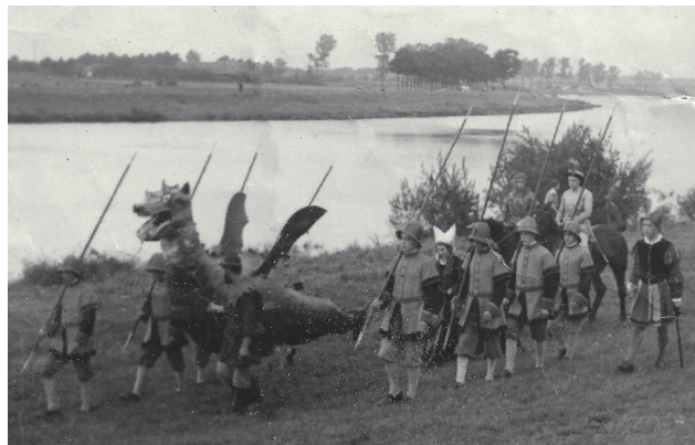
Spelmoment uit 1954.

Mede door de afkalving van de Maasoevers besloot men vanaf 1967 het spel geheel te verplaatsen naar een locatie in het dorp nabij kasteel