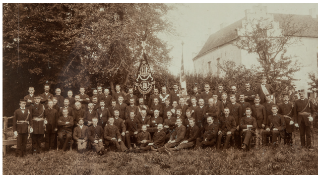
Schutterij St. Georgius en St. Sebastianus is statutair verplicht "om de zeven jaar" de draak te steken. Foto dateert uit 1896 en hangt in de Gildekamer aan de Muizenboekerweg.